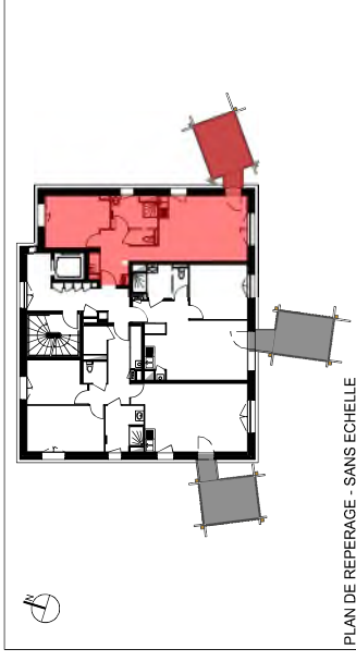
PLAN DE REPERAGE - SANS ECHELLE