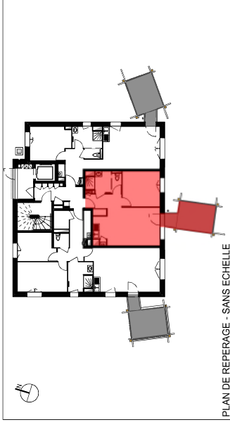
PLAN DE REPERAGE - SANS ECHELLE