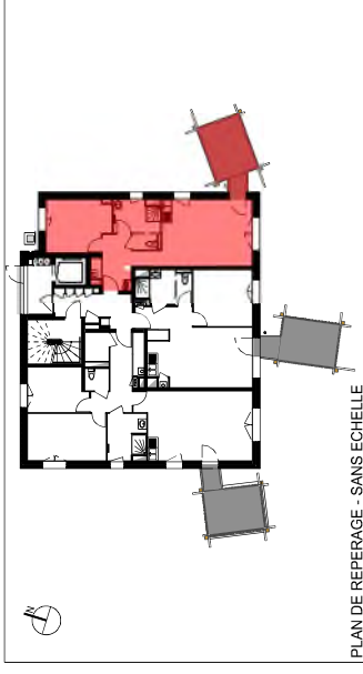
PLAN DE REPERAGE - SANS ECHELLE